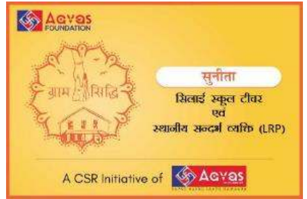
Women Identity and Dignity

To make Rural women financially strong, confident, resilient and mitigate poverty through skill development and enterprise promotion.