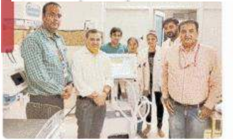
पत्रिका न्यूज नेटवर्क patrika.com

उज्जैन। आवास फाउंडेशन एवं एडवांस इन्फॉर्मेशन मैनेजमेंट सोसाइटी द्वारा चलाये जा रहे कोरोना जागरूकता रथ के माध्यम से विभिन्न क्षेत्रों में लोगों को कोरोना वायरस के संक्रमण से बचाव की जानकारी दी जा रही है। पालदा इंदौर के आदि क्षेत्र में जागरूकता कार्यक्रम चलाया गया। आवास फाउंडेशन एंड एडवांस इनफॉर्मेशन मैनेजमेंट सोसाइटी उज्जैन के कलाकार द्वारा लोगों को संक्रमण से बचाव की जानकारी दी गयी। कलाकारों द्वारा नुक्कड़ नाटक और गीत के माध्यम से लोगों को बताया जा रहा है कि कोरोना वायरस के संक्रमण से कैसे बचा जा सकता है। इसको लेकर संस्था द्वारा जागरूकता कार्यक्रम चलाया जा रहा है। लोगों को बताया कि लॉक डाउन अभी खत्म हुआ है, कोरोना का संक्रमण जारी है। इसलिए सामाजिक दूरी बनाए रखें, जब भी घर से निकलें तो मास्क जरूर पहनें।